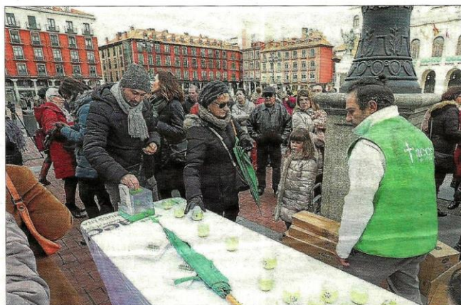
Mesa de cuestionación de la AECC en la Plaza Mayor durante el acto de geolocalización de la lucha contra el cáncer. ICAI

Redacción, Administración y Publicidad: C/ Manuel Caner Acevedo, nº 1. 47016, Valladolid Teléfono: 983 42 17 00. Fax: 983 42 17 17. E-mail de Redacción: elmundo-ylgbc-elmundo.es; local.vagdv-elmundo.es E-mail de Publicidad: publicidad.vagdv-elmundo.es