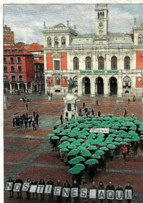
La AECC creó su particular 'gota de lluvia'. ICAI

Uno de los objetivos de la asociación, ha agregado el presidente de AECC en Valladolid, es darle a la vida un «tono verde», color de la esperanza que ya se ha convertido en su emblema. Por ello, han recreado la característica «gota de lluvia» que marca la situación en los mapas —punto de geolocalización— para que la gente «les busque», porque, como rezaba su lema «están aquí» para aquellos