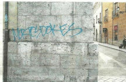
Pintada en la piedra de la iglesia de San Miguel.